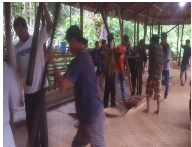
Gambar 4. Kegiatan Nutuk Beham

Beham yang sudah ditumbuk dengan alu, lalu diayak untuk menghilangkan kotoran, selanjutnya masukan air panas sehingga berbentuk seperti kue, dicampur dengan parutan kelapa dan gula merah dan diaduk hingga rata. Namanya Bungkal Beham. Bungkal beham yang sudah jadi ditaruh dalam wadah dan bisa disantap sebagai ucapan terima kasih kepada penduduk atas panen yang melimpah setelah para dewa (dukun) bemegang (membaca mantra) guna memanggil nenek moyang mereka untuk makan (Tim Protokol Kukar, 2016) . Mantra yang diucapkan saat memanggil arwah leluhur untuk makan bersama ini merupakan salah satu tradisi lisan yang masih ada hingga saat ini. Hal ini tentu saja bisa menjadi daya tarik bagi para wisatawan yang berkunjung. Salah satu upaya yang dilakukan oleh masyarakat Kedang Ipil yang tergabung dalam kelompok sadar wisata untuk memperkenalkan tradisi ini kepada khalayak ramai adalah mempromosikannya melalui media iklan untuk menarik lebih banyak pengunjung untuk berwisata ke desa mereka. Kegiatan nutuk beham dapat dilihat pada gambar 4.