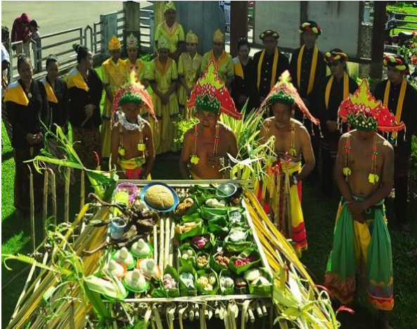
Gambar 2. Acara menjamu benua