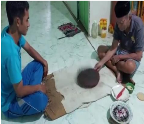
Gambar 5. Tenong lawang