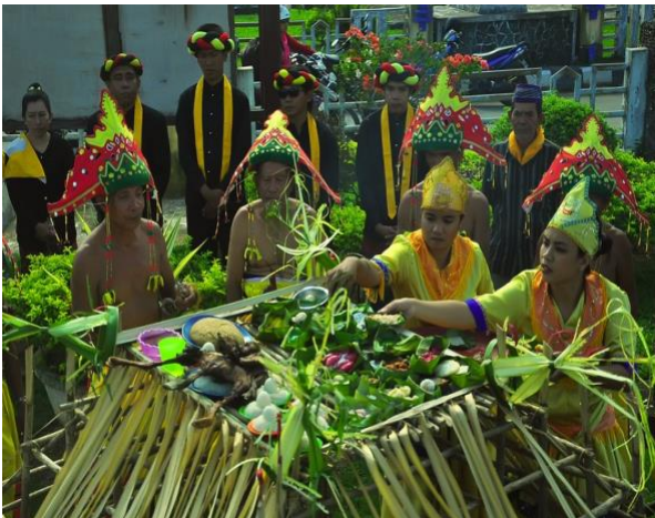
Gambar 3. Acara menjamu Benua