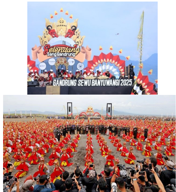
Gambar 2 Festival Gandrung Sewu Figure 2 Gandrung Sewu Festival

Gandrung Sewu merupakan seni kebudayaan yang menjadi bagian dari rangkaian kegiatan Banyuwangi Festival (B-Fest) sejak tahun 2012. Cikal bakal penyelenggaraan Gandrung Sewu murni dilakukan oleh Paguyuban Pelatih Seni dan Tari Banyuwangi (Patih Senawangi), sebagai bentuk pelestarian kebudayaan lokal oleh para seniman. Pertunjukan kolosal yang menceritakan berdirinya Kerajaan Blambangan ini, melibatkan 1000 lebih penari Gandrung dari berbagai lapisan usia (mayoritas usia remaja) (Kanom, 2023a; Kanom, Wijaya, & Rusmawan, 2024).