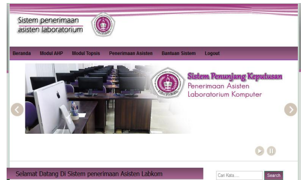
Gambar 3. Halaman Utama Sistem

Halaman utama merupakan pintu gerbang utama untuk masuk ke dalam sistem aplikasi selanjutnya. Dari sini semua aplikasi akan di mulai.